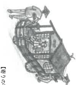
【寄りの視点】イメージ