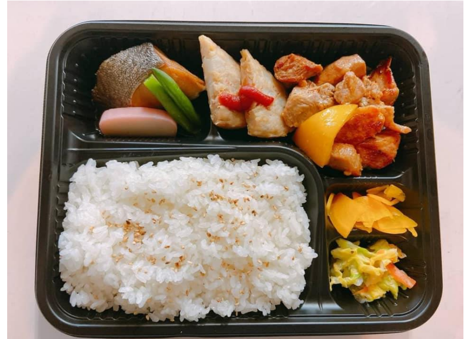
生姜焼き弁当、からあげ弁当、幕の内弁当、カレーライス 各500円