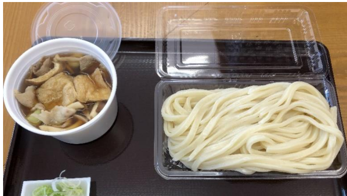
肉きのこ汁うどん