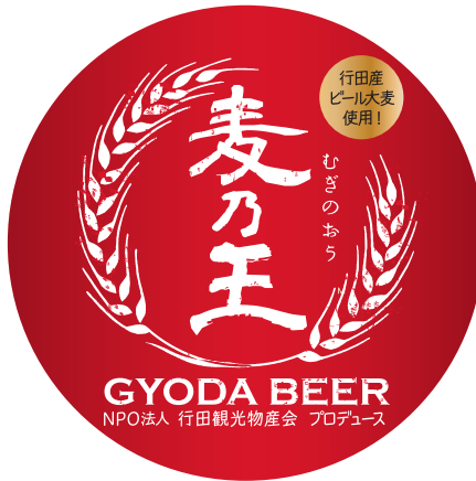
⑤麦乃王(むぎのおう)