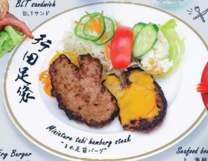
Miniature tabi hamburger steak "まめ足袋バーグ"