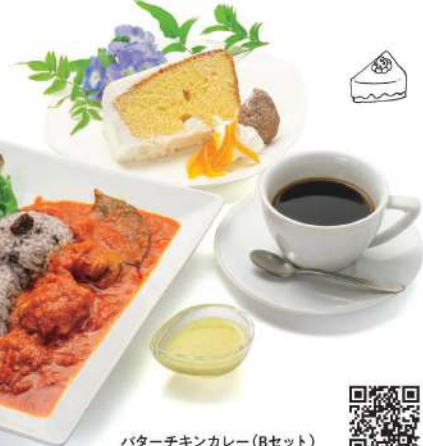
バターチキンカレー(8セット) (古代米カレー+コーヒータン+シフォンケーキ付) Butter chicken curry (B set)