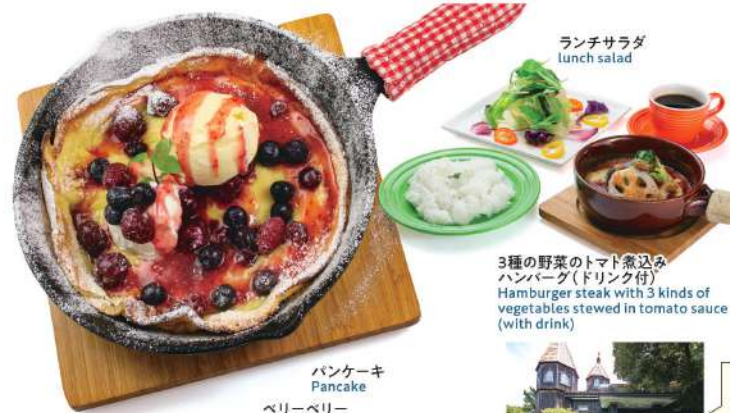
パンケーキ Pancake ベリーベリー (バニライスのトッピング付) Berry Berry with Vanilla ice cream topping

1つ1つ手作りでお出ししています。スキレットで焼くドイツ風パンケーキです。 Each one is handmade and served individually. German style pancakes cooked in a skillet.