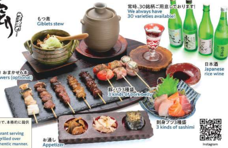
もつ煮 Giblets stew

常時、30銘柄をご用意しております! We always have 30 varieties available!