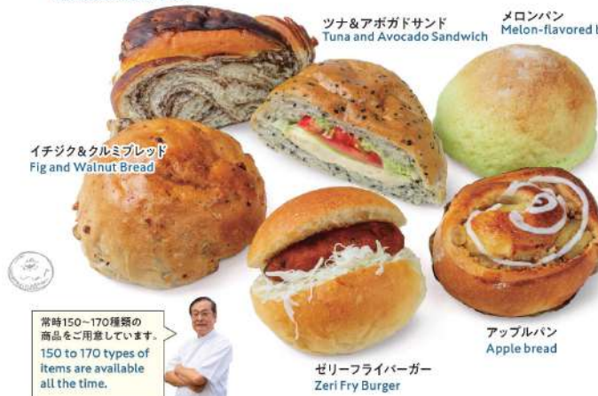
イチジク&クルミブレッド Fig and Walnut Bread

常時150～170種類の商品をご用意しています。150 to 170 types of items are available all the time.