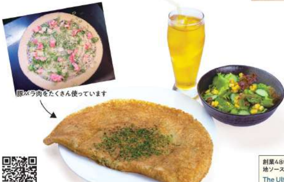
サラダセット (フライ+ドリンク+サラダ) Salad Set (Fry + Drink + Salad)