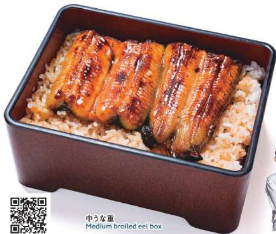
中うな重 Medium broiled eel box