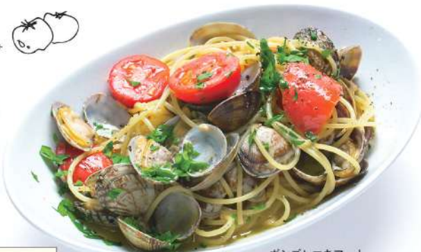
ポンゴレマキアート Spaghetti alle vongole macchiato

田園風景を見ながら、手づくりのイタリア料理を召し上がれ!! Look over a rural landscape while enjoying the flavors of hand-crafted Italian cuisine.