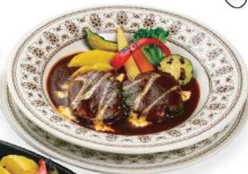
ビーフシチュー(単品) Beef Stew (single item)