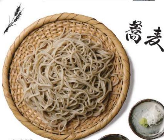
せいろそば Seiro Soba

*店舗でご確認下さい。 *Please check at the store. *カードは夜のみ使用可 *Credit cards can only be used at night.