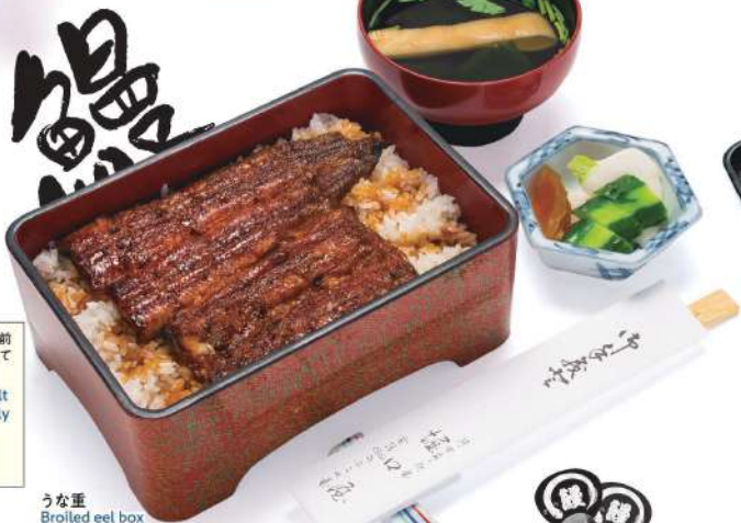
うな重 Broiled eel box

These dishes are the result of intense efforts by highly skilled artisans, and are offered at reasonable prices.