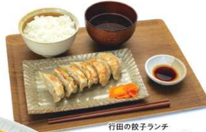
行田の餃子ランチ (餃子+スープ+つけもの+ご飯) Gyoda no Gyoza Lunch