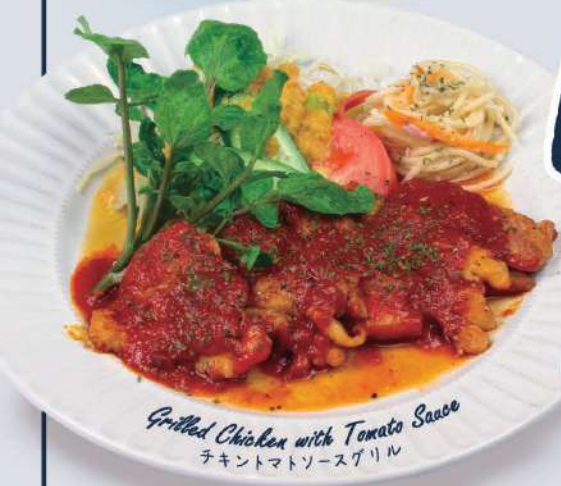
Grilled Chicken with Tomato Sauce チキントマトソースグリル