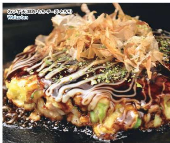
わいず天 (屋内・もち・チーズとろろ) Wafutan

文化庁では、地域で世代をこえて受け継がれてきた食文化を、「100年続く食文化「100年フード」と名付け、関連団体と継承・発信をする活動を行っています。行田市では「フライ・ゼリーフライ」が認定されています。