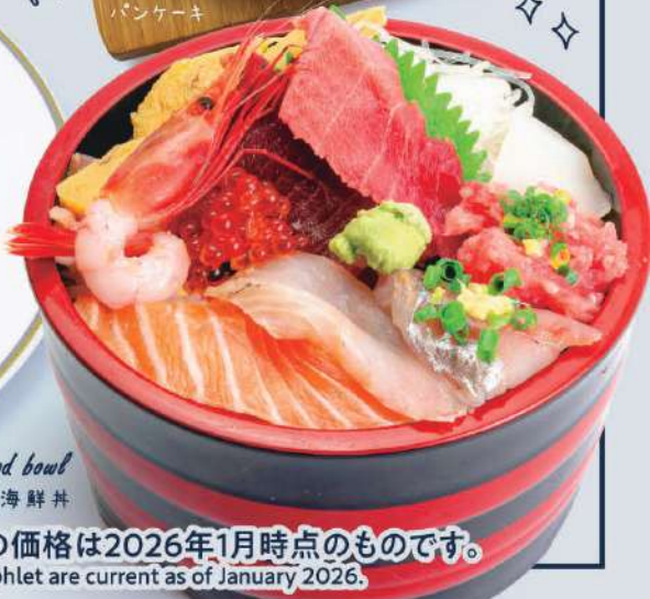
Seafood bowl 上海鮮丼

※都合により、営業時間が変更になる場合がございます。ご了承ください。 Note: Business hours may change due to circumstances. Please understand.