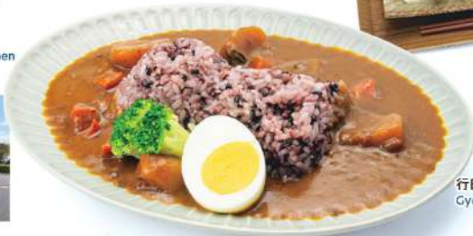
行田古代米カレー Gyoda ancient rice curry