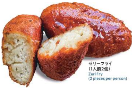
ゼリーフライ (1人前2個) Zeri Fry (2 pieces per person)