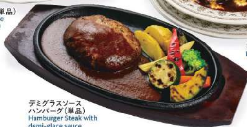
デミグラスソースハンバーグ(単品) Hamburger Steak with demi-glaze sauce (single item)