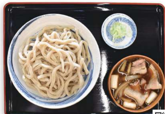
肉汁うどん Meat Soup Udon