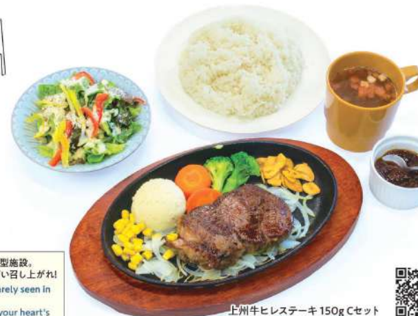
上州牛ヒレステーキ 150g Cセット Joshu beef fillet steak 150g C set