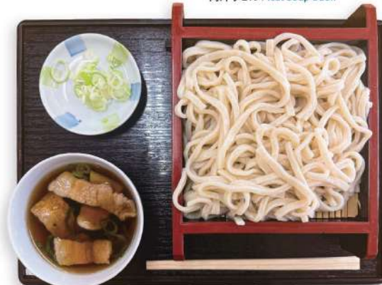
肉汁うどん Meat Soup Udon