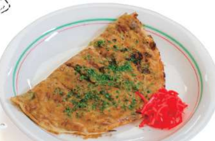
ふらいセット (フライ+お飲み物) Fry set (Fry and a drink)

厳選した素材を使用。こだわりの粉やソースが味の決め手です。 Uses only the finest, carefully selected ingredients. Special powders and sauces determine the flavors of this shop.