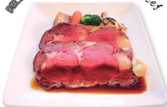
ローストビーフ Roast Beef