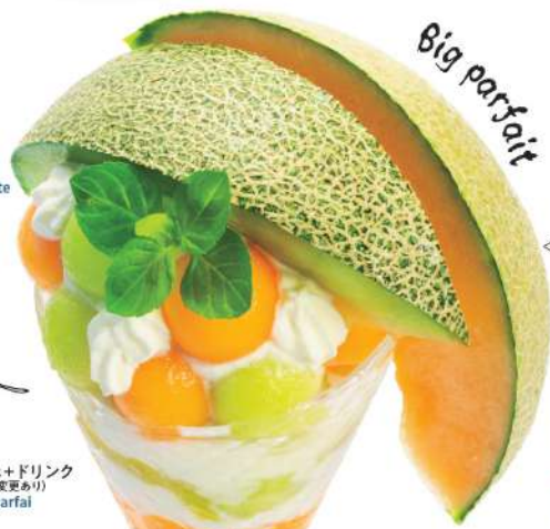
季節限定パフェ+ドリンク (季節によって果物の変更あり) Seasonal Fruit Parfait