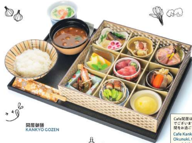
閑居御膳 KANKYO GOZEN