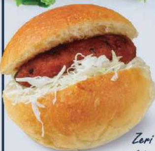
Zeri Fry Burger ゼリーフライバーガー