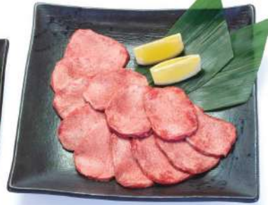
上タン塩(写真は2人前) Top-grade tongue salt (photo for two people)

和牛の3点盛り(1~2人前) Three pieces of Wagyu beef (for one or two people)