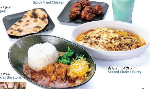
炙りチーズカレー Seared Cheese Curry

スープカレー(ほうれん草、 チーズのトッピング付) Soup curry with spinach and cheese toppings