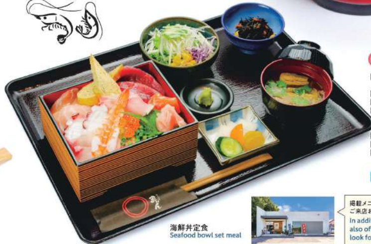
海鮮丼定食 Seafood bowl set meal