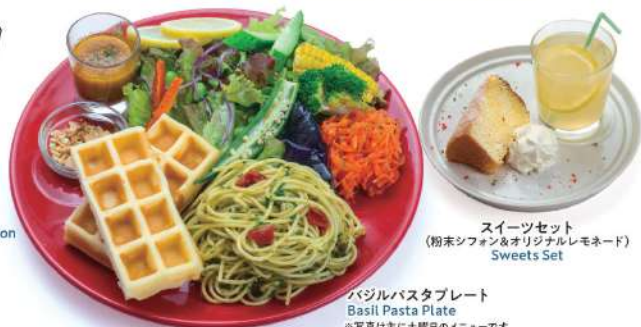
バジルパスタプレート Basil Pasta Plate ※写真は主に土曜日のメニューです。

元足袋屋さんの集合宿舎をリノベした日替りカフェです。日々違うお店の味をお楽しみください。※その日の内容はSNSをご覧ください。 We are a rotating daily cafe, renovated from a former Tabi (traditional Japanese socks) craftsman's collective lodging. Enjoy the unique flavors of a different shop every day! * Please check our social media for the day's specific offering.