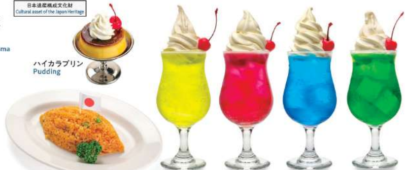
想い出のチキンライス Chicken Rice